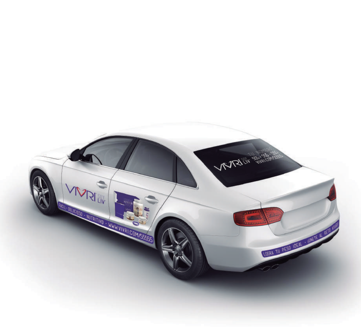
EJEMPLO CALCOMANÍAS AUTOMÓVIL