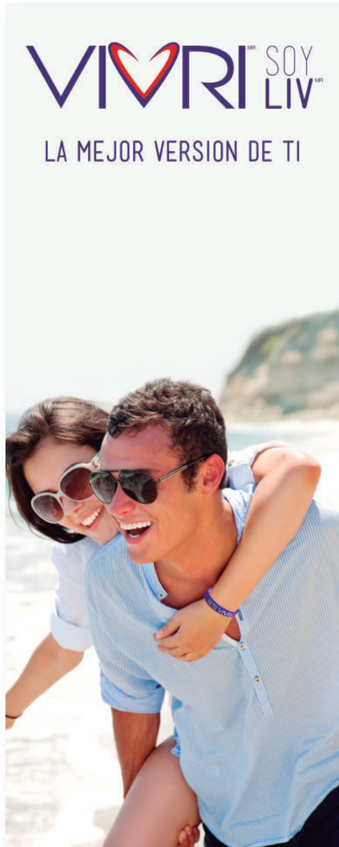
EJEMPLO ROLL UP 1