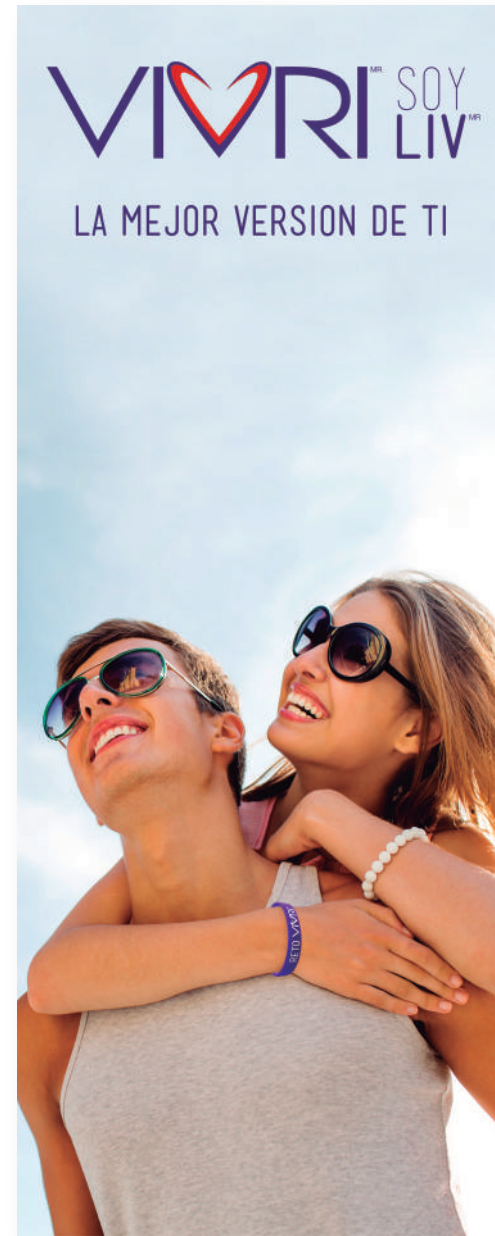
EJEMPLO ROLL UP 2