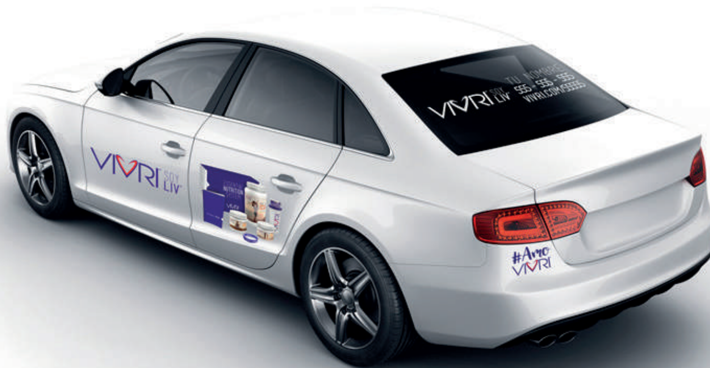
EJEMPLO CALCOMANÍAS AUTOMÓVIL