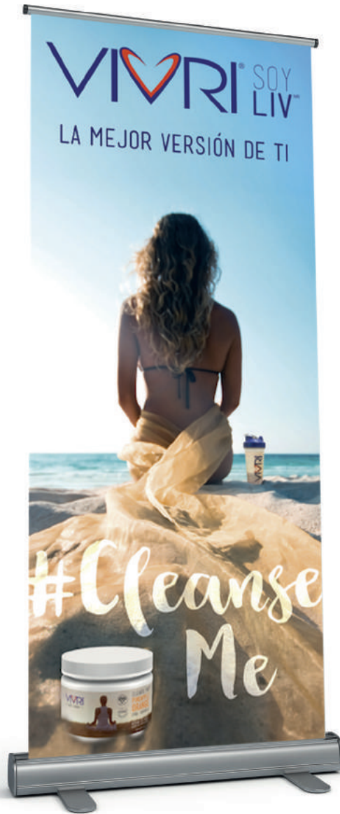
EJEMPLO ROLL UP 1