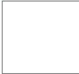
PANTONE: Bright White C: 0 M: 0 Y: 0 K: 100